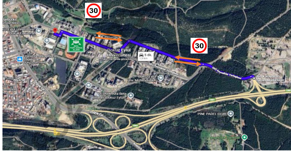
Şekil 6: Trafik Eylem Planı

KANALİZASYON SİSTEMİ, ELEKTRİK, SU ŞEBEKESİ VB. PROJE TARAFINDAN KULLANILAN ALTYAPILAR