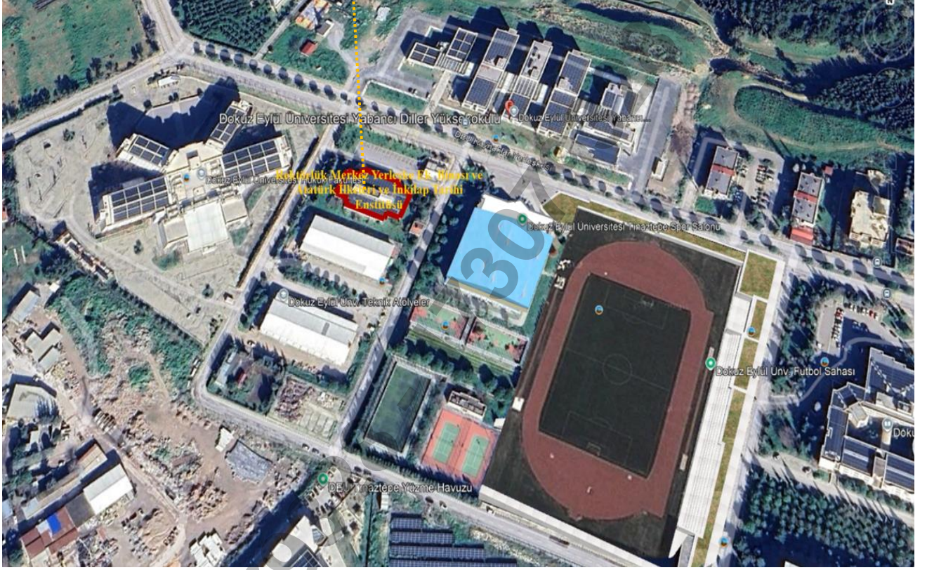
Şekil 1: Tınaztepe Kampüsü, Rektörlük Merkez Yerleşke Ek Binası ve Atatürk İlkeleri ve İnkılap Tarihi Enstitüsü Binası