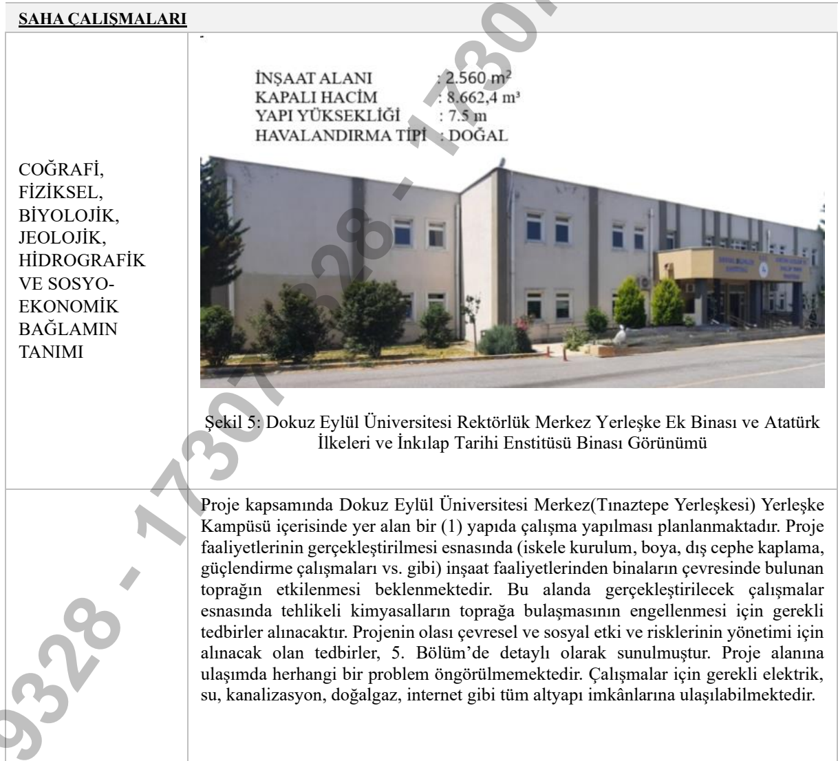
Tablo 3: Yürütülecek Çalışmalara İlişkin Özet Bilgiler

Dokuz Eylül Üniversitesi Tınaztepe Yerleşkesi'nde bulunan Atatürk İlkeleri ve İnkılap Tarihi ile Rektörlük Merkez Yerleşke Ek Binasında gerçekleştirilecek yapısal güçlendirme ve enerji verimliliği çalışmalarına dair özet teknik bilgiler aşağıda Tablo 3'te verilmektedir. Bu ÇSYP; proje ömrü boyunca, inşaat alanında ve projenin internet sitesinde ( https://kamuguclendirmecsb.gov.tr/ ) tüm paydaşların erişimine açık olacaktır. Ayrıca paydaşların bilgilendirme toplantısı öncesi proje hakkında yeterli bilgiye sahip olarak toplantıya katılımlarını sağlamak için taslak ÇSYP Proje binasında ve çevre binalarda erişilebilir noktalarda askıya çıkacaktır. Ayrıca Dokuz Eylül Üniversitesi resmî web sayfasında ( www.deu.edu.tr ) ve KADEV Projesi resmi web sayfasında toplantıdan en az 10 gün önce yayınlanacaktır. Yüklenici bünyesinde tam zamanlı bir çevre uzmanı, bir sosyal uzman ile bir iş sağlığı ve güvenliği (İSG) uzmanı; İnşaat Kontrollük Müşavir firması bünyesinde ise bir çevre uzmanı, bir sosyal uzman ve bir İSG uzmanı istihdam edilecektir. Bu uzmanların her biri tam zamanlı olarak sahada olacaktır. Müşavir, Yüklenici ve Bakanlık Proje Uygulama Birimi (PUB) paydaşlar tarafından gelen çevresel, sosyal ve İSG konularına yönelik soru ve görüşlerin kayıt altına alınması ve cevaplanmasından sorumlu olacaktır.