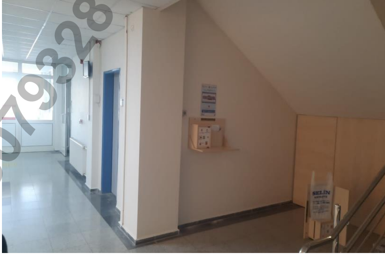
Şekil 7: Şikayet Kutusu Yerleşimi