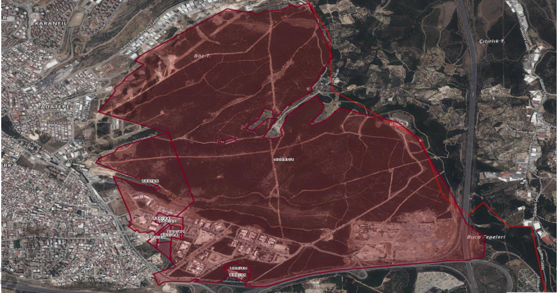
Şekil 2: Kampüs Sınırları (53097/1, 750/65, 750/24, 750/25, 803/12, 803/14, 803/20, 800/10, 800/11 Parsel)

Kampüs sınırlarını gösterir uydu görseli Şekil 2’de sunulmaktadır.