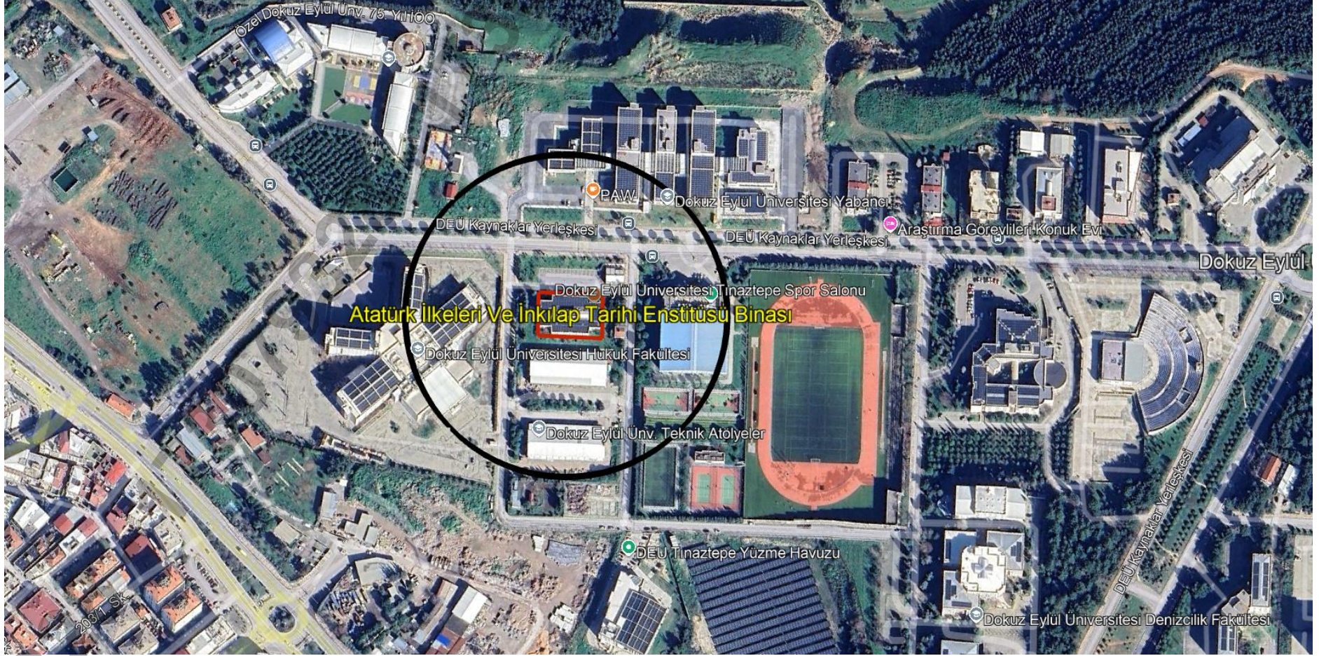
Şekil 4: Proje Kapsamına Giren Binanın Majör Etki Alanı ve Yakın Çevresi Görüntüsü